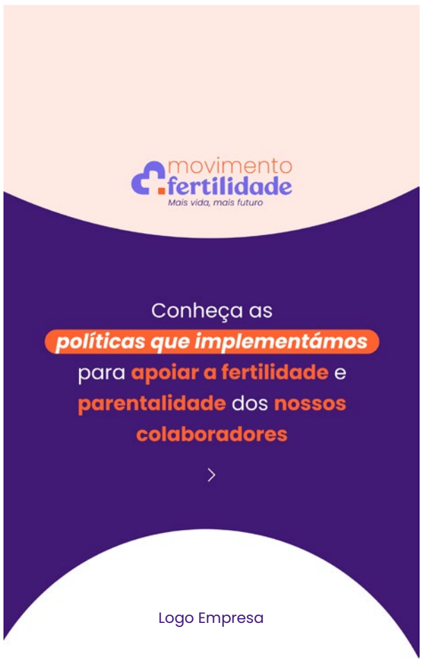
Primeiro Slide (abertura)