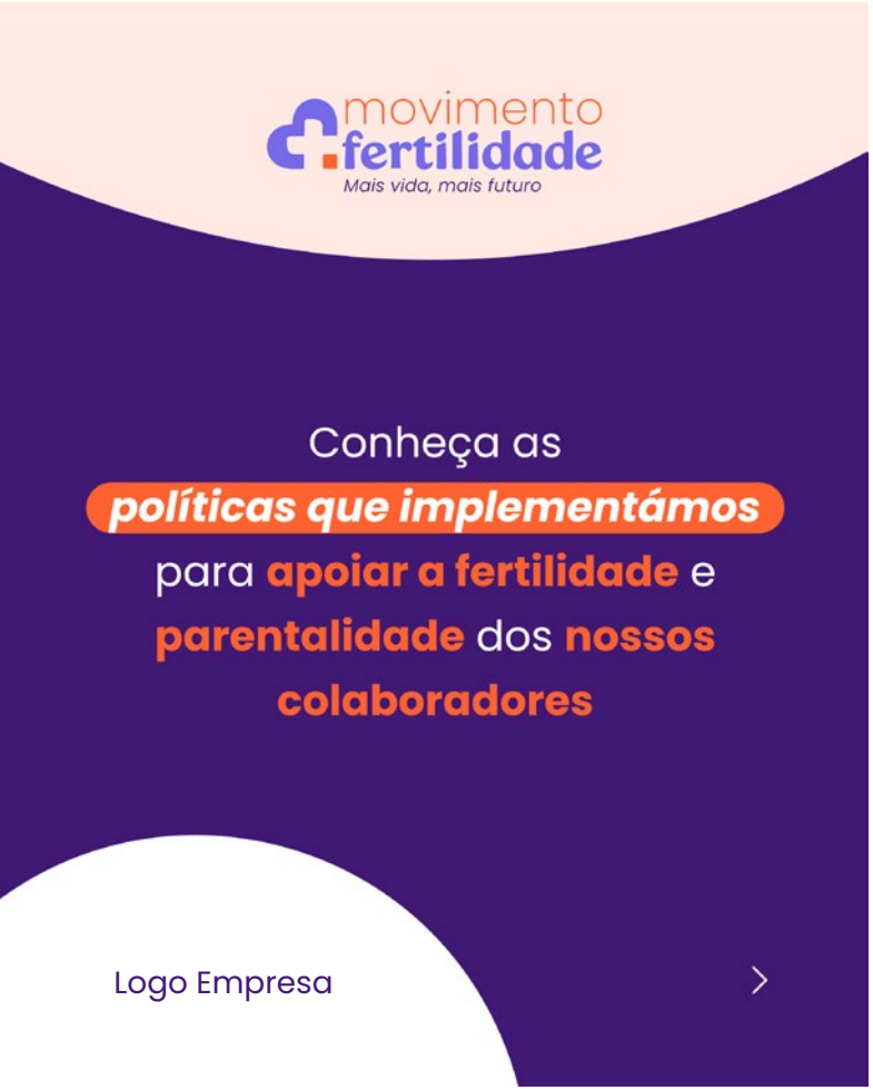
Primeiro Slide (abertura)